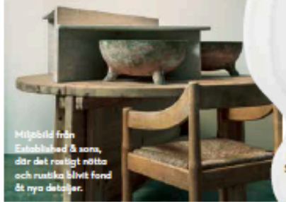
Möjebild från Established & sons, där det rostigt röttta och rustika blivit fond för nya detaljer.