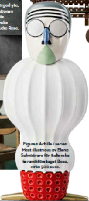
Figuren Achille i serien Most illustrious av Elena Salmistraro för italienska le ramiförm taget Bosa, cirka 500 euro.